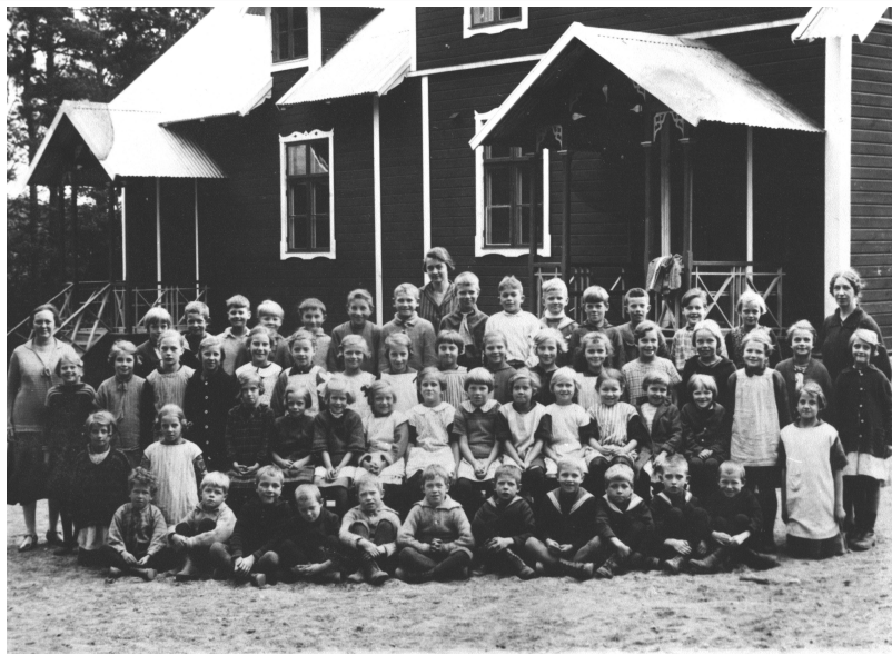
Bild 9. Roslags-Kulla skola