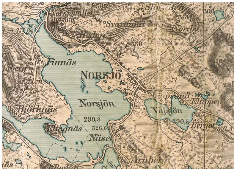
Bild 3. Norsjö vid 1900-talets början (1902, enstaka ändringar 1933).