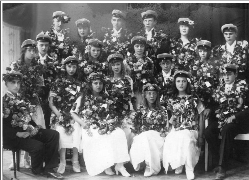
Bild 7. Realskolexamen